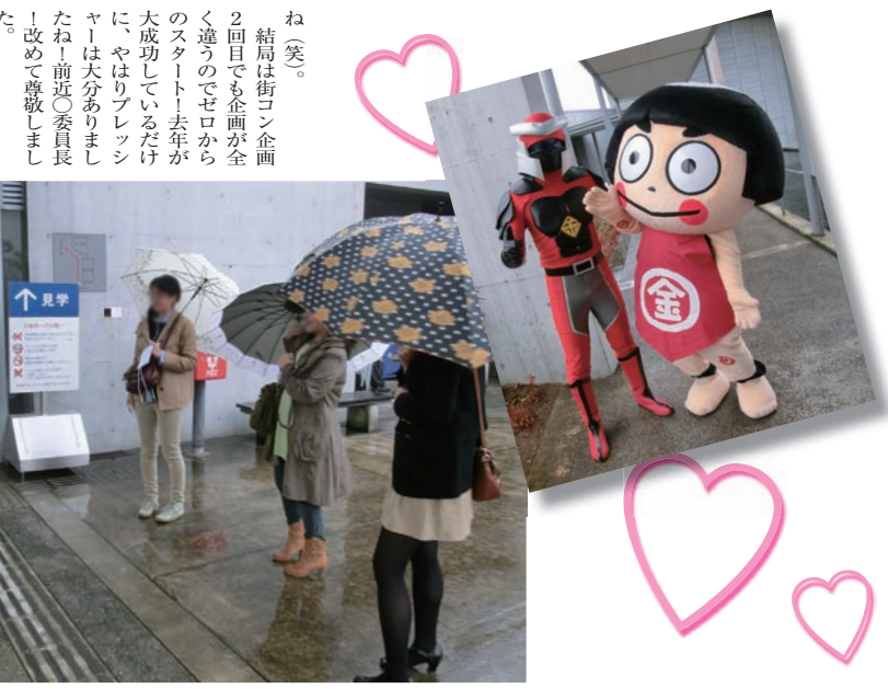
ね(笑)。結局は街コン企画2回目でも企画が全く違うのでゼロからのスタート！去年が大成功しているだけに、やはりプレッシャーは大分ありましたね！前近○委員長！改めて尊敬しました。

い、見学中も男女で会話し仲良くなつてもらえれば嬉しいなという試みでしたが(南足柄市のゆるキャラ的存在である)も参加した盛りがるんじやない？と素敵アアイデアを頂き即採用！良いアドバイス有難うございました。 後、急遽決まった事と言えは、私のほぼ独断で今年も街コンで着るユニフォームが欲しいと騒ぎ立て、街