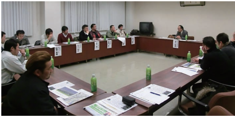
川上県議会議員と青年部との交流会

国植樹祭のときには、全面的に協力され、事前に子供植樹祭等を実施され盛り上げていただきました。 金太郎祭りの際には中心の役割を担っています。 昨年、今年と「南足柄街コンイベント」等、街づくりに活躍しております。 将来の南足柄を背負って立つ逸材を育てるため、良く勉強もされ、日々努力され