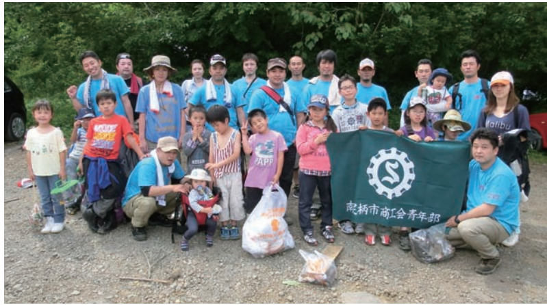
奉仕活動美化清掃

もしました。 そして、電気の仕組み、発電の仕組みなどの紹介コーナーに移動してみると、色々な体験コーナーがあり、そこで、原子力発電の効率の良さなど学び、当たり前ですが、火力発電よりCO2の排出は少なく、環境汚染が少なくなる事を改めて知り、また色々考えさせられました。今後、原子力発電所が再稼働の可能性が高くなって来た場合、私たちがどうするかを、私たちが考えて答えを出して行かなくてはならないと感じました。原子力以外の発電の仕組み、体験、電気が発見された経緯など様々な電気の事、なんか理科の勉強みたいで面白かったです。