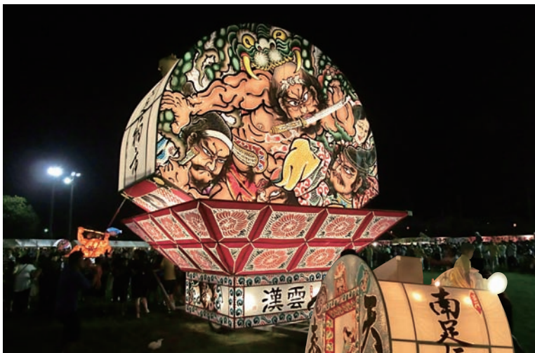
見事な「ねぶた」がきんたろう祭りを彩りました